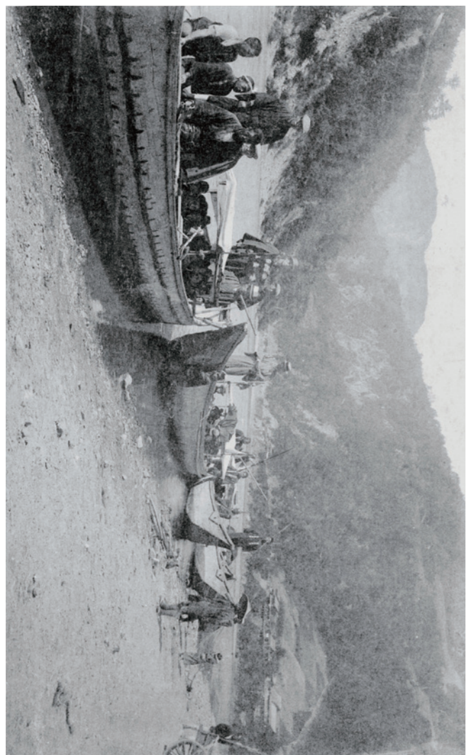
春期企画展 富士川水運の300年