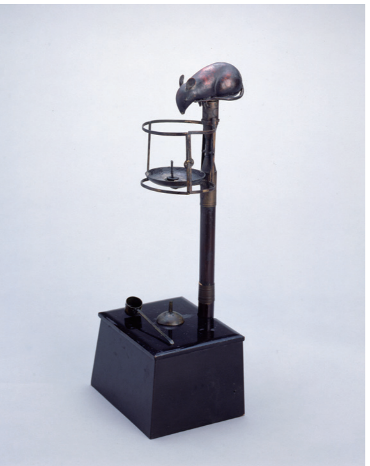
夏期企画展 どうぶつ百景——江戸東京博物館コレクションより