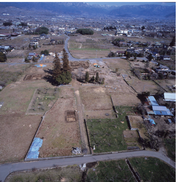
シンボル展 甲斐国分寺