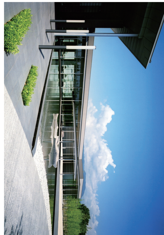
山梨県立博物館 | Yamanashi Prefectural Museum