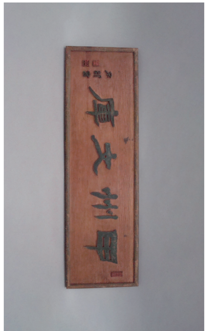
シンボル展 郷土史をのこした人々